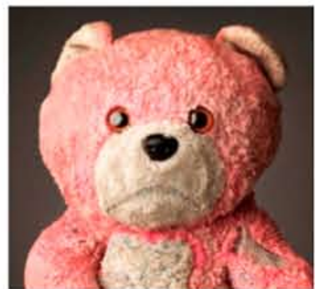
汚れ・傷みがひどい