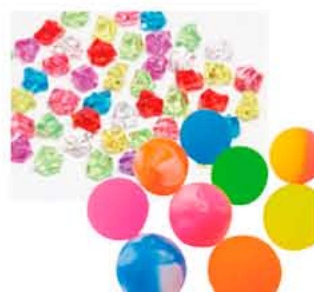
アクリルアイス スーパーボール