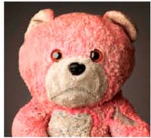
汚れ・傷みがひどい