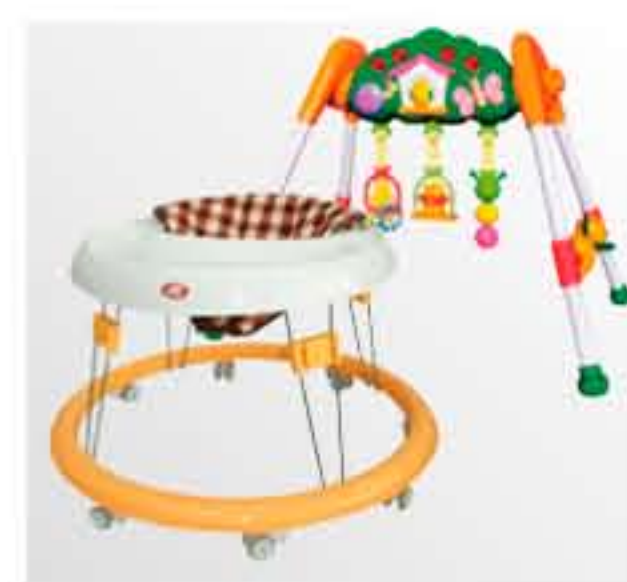
歩行器・ベビー用品