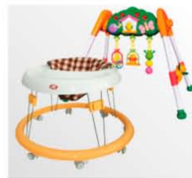
歩行器・ベビー用品