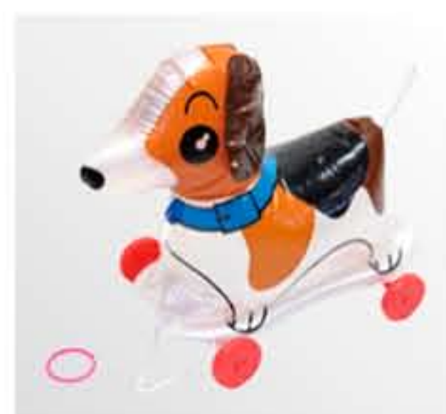
風船・ビニール玩具