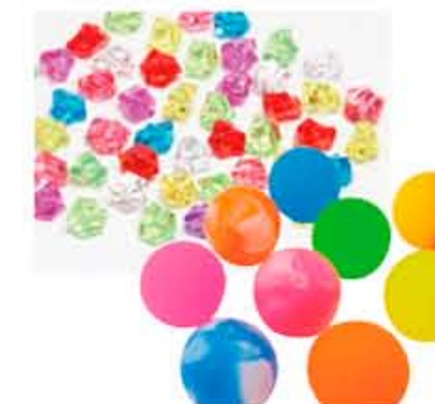
アクリルアイス スーパーボール