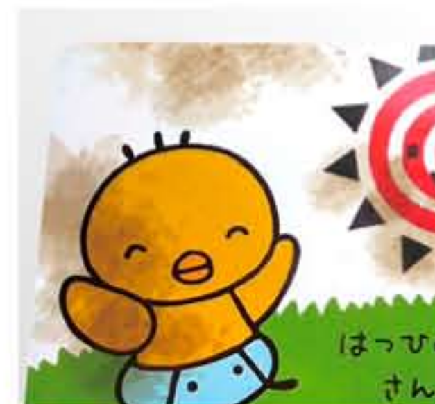
汚れのひどい絵本 破損している絵本