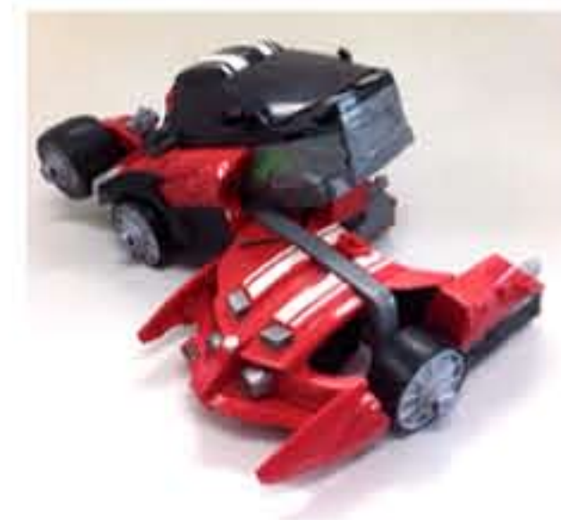
破損している・故障