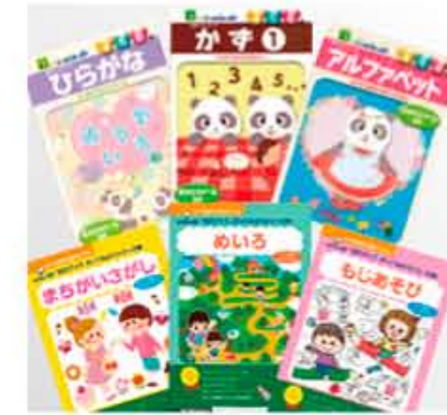
学習本・付録の本