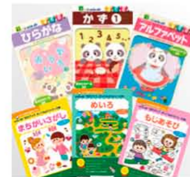
学習本・付録の本